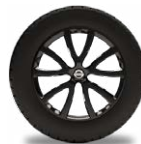
Черные 17" легкосплавные диски